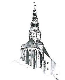
Kościół pw. Św. Stanisława i Św. Wacława Katedra Diecezji Świdnickiej